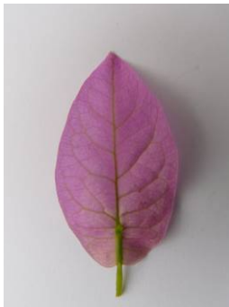
1 schmal eiförmig