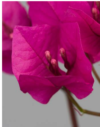
Junges Hochblatt - Kelchlappen nicht geöffnet