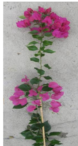
3 axillar und terminal

Zu 18: Blütenstand: Anordnung der Hochblattbüschel