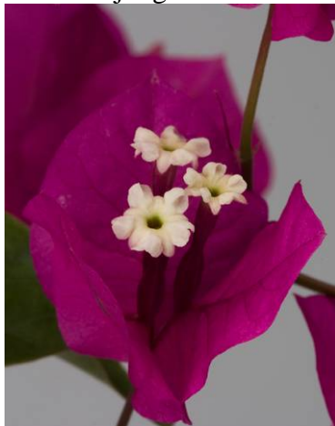
Junges Hochblatt - Kelchlappen geöffnet