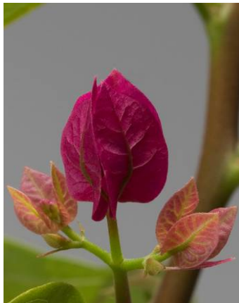
Kleines junges Hochblatt

Zu 35: Hochblatt: Hauptfarbe der Innenseite (Kelchlappen verwelkt)