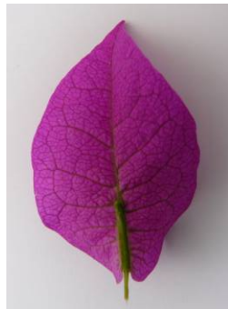
2 mittel eiförmig