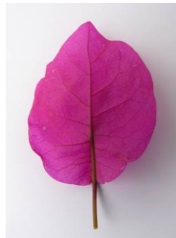
3 breit eiförmig