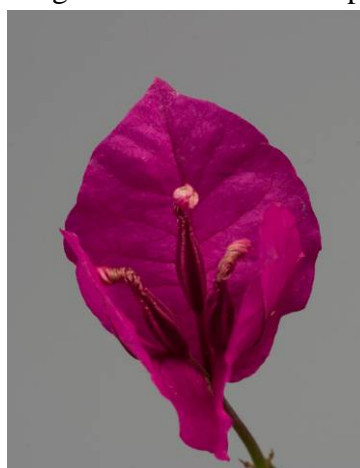
Hochblatt - Kelchlappen verwelkt