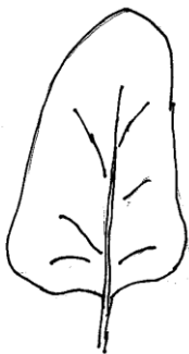
1 fehlend oder sehr gering