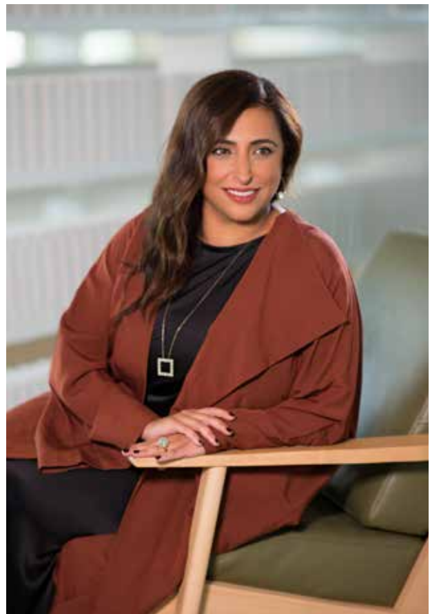
图: Ivana Maglione

我认为国际出版商协会如今处于目标最为明确的时期。2019冠状病毒病爆发时, 国际出版商协会主导开展了集体应对和复苏计划, 收集和