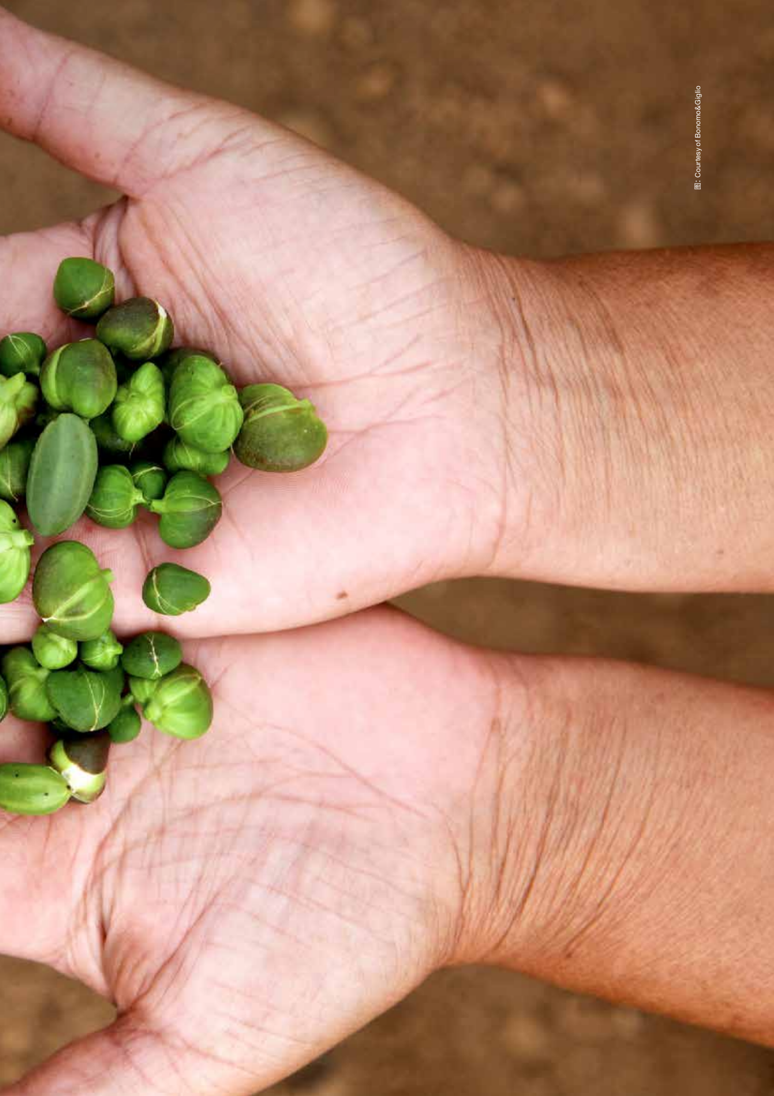
Fig. 1.