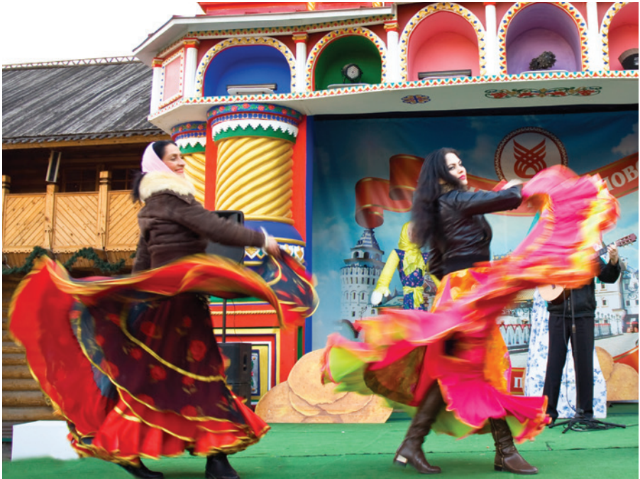
2014年送冬节狂欢期间，俄罗斯莫斯科街头舞台上的吉普赛艺术家

庆典可以开发出许多商标：可分为传统商标（名称、图像）和非传统商标（用于庆典留念的3D商标；用于视频片段、电视短片和广告的声音商标和动态商标；用于促销广告的口号）。