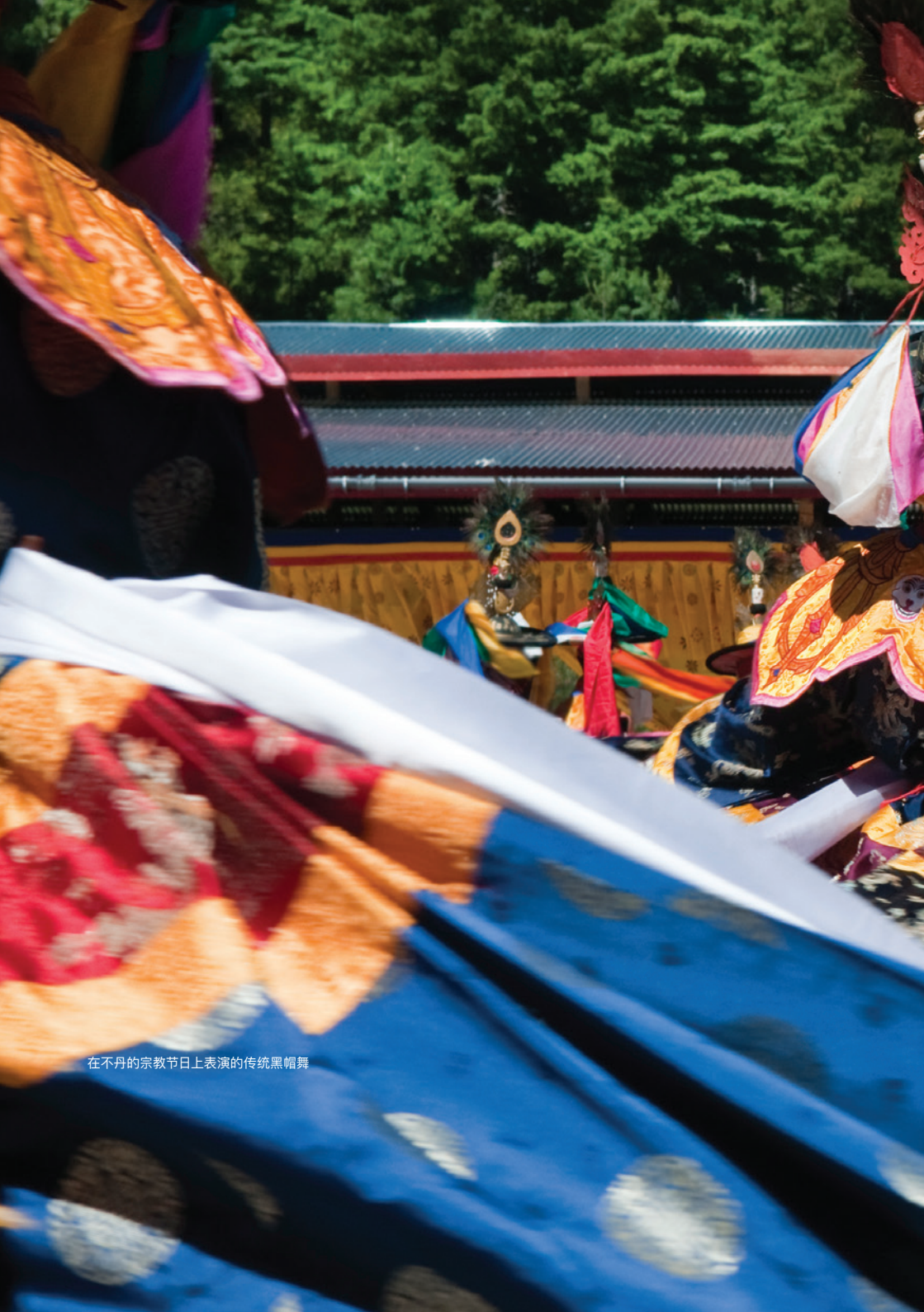
在不丹的宗教节日上表演的传统黑帽舞