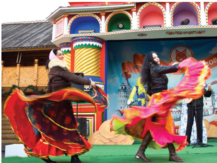
Артисты цыганского театра во время уличного представления на Масленицу, Москва, Россия, 2014 г.