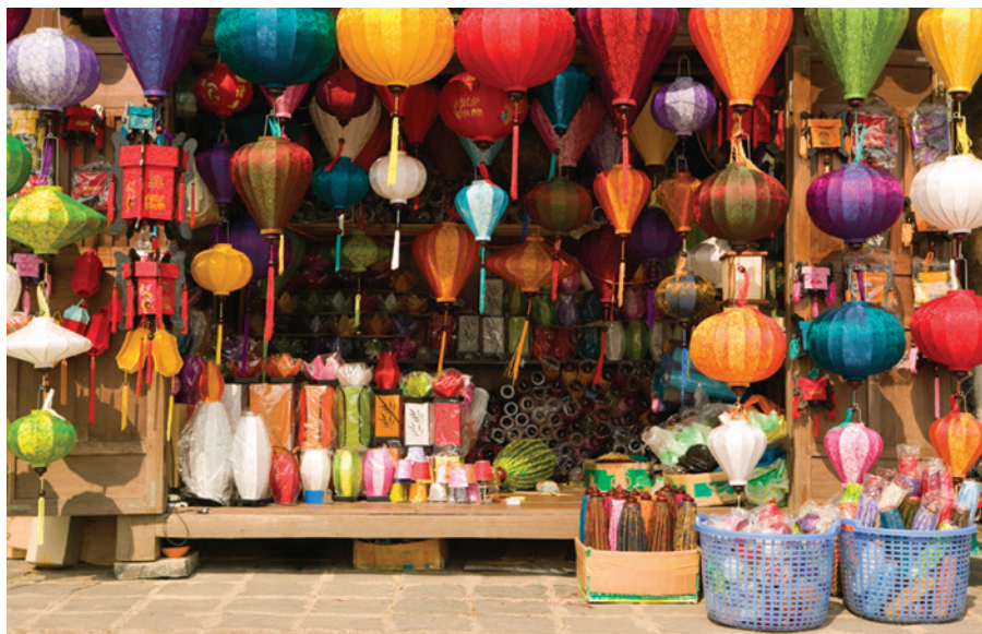
Продажа шелковых фонарей на базаре в Хойане (Вьетнам)