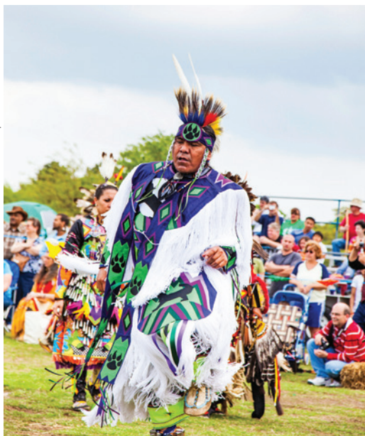
Участники фестиваля Североамериканских индейцев в костюмах индейцев танцуют на «Празднике жизни» в парке Маунт-Трэмор, Вирджиния-Бич, США, 2011 г. Это было бесплатное общественное мероприятие, посвященное вопросам общественного достояния.

листовках. В свете вышеизложенного для использования фотографий организаторам фестиваля, вероятно, потребуется разрешение фотографа, владельца авторского права на изображенное произведение, а также людей, изображенных на снимке. Что касается освещения мероприятия, см. вставку 18 «Могут ли организаторы фестиваля осуществлять запись и показ всех мероприятий в рамках фестиваля?»