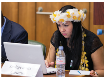
Заседание Межправительственного комитета ВОИС по интеллектуальной собственности, генетическим ресурсам, традиционным знаниям и фольклору, 3 февраля 2014 г.

Это не означает, что ТЗ и ТВК могут свободно использоваться на любом фестивале. Произведения, основанные на ТВК , могут охраняться авторским правом или смежными правами: например, фильм о традиционной церемонии, вероятно, будет охраняться как кинематографическое произведение; при записи песни будут задействованы смежные права; современная адаптация народной песни, вероятно, будет охраняться авторским правом, а для использования фотографий традиционных костюмов потребуется разрешение фотографа. В этих примерах использование произведения, основанного на ТВК, может потребовать получения предварительного разрешения, как и в случае с любым произведением, охраняемым авторским правом.