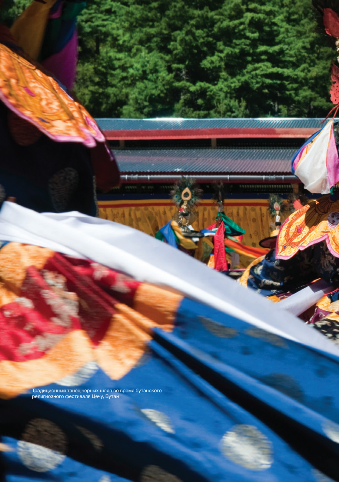
Традиционный танец черных шляп во время бутанского религиозного фестиваля Цечу, Бутан