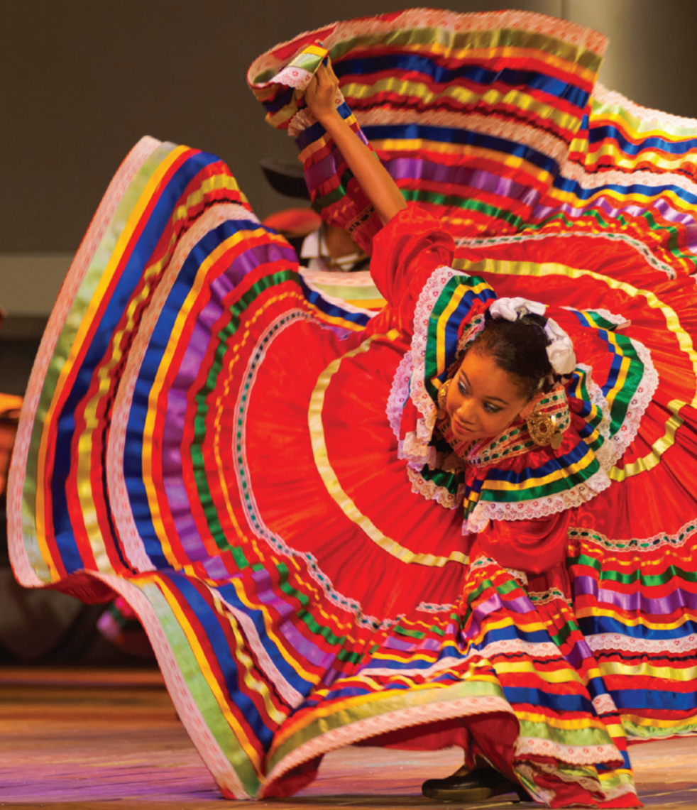
Народный танец мексиканского штата Халиско, Сеул, Республика Корея, 2009 г.