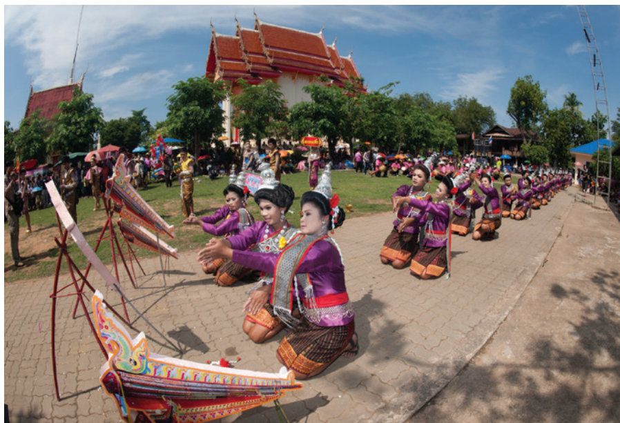
Традиционный тайский танец во время фестиваля ракет «Бун Банг Фай», провинция Ясотхон, Таиланд, 2013 г.