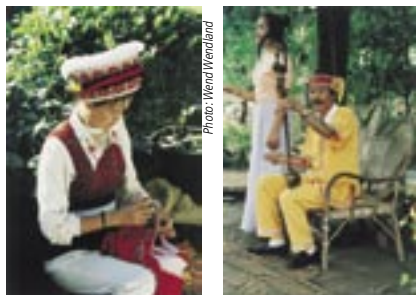
传统文化艺人和表演者，中国云南省

考虑到这些实例，在世界知识产权组织1998年进行的实况调查团调查和咨询活动中，在探讨了土著和地方社区中确定了三种解决方式：