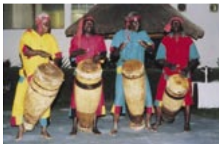
赞比亚国家舞蹈演员