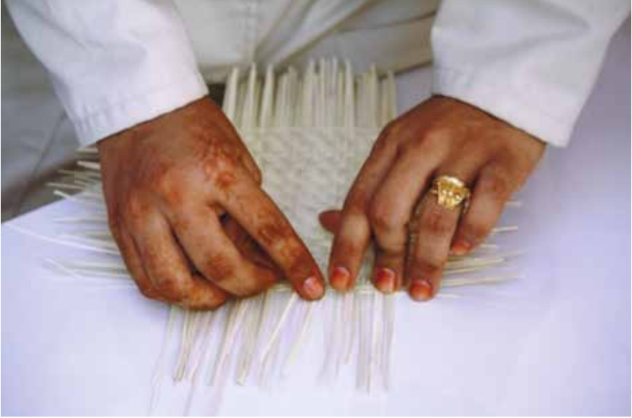
صانع سلة من قناح

وقد تكون أشكال التعبير الثقافي التقليدي مادية أو غير مادية أو، كما هو حالها في أغلب الأحيان، مزيجاً بين الحالين. ومن المؤكد أنه في كثير من الأحيان ينطوي أي جسم مادي على عنصر رمزي أو ديني لا ينفك عنه. ومن الممكن ضرب مثل لذلك بسجادة منسوجة (تعبير مادي) تعبر عن عناصر من قصة تقليدية (تعبير غير مادي).