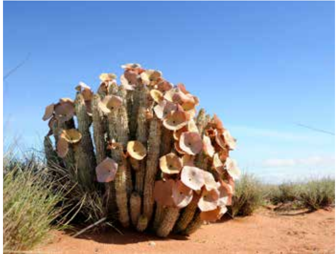
نبات الهوديا